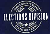
Exhibit C Anexo C

Early Voting begins Monday, October 21, 2024 and ends on Friday, November 1, 2024 La Votación Adelantada comienza el lunes, 21 de octubre de 2024 y termina el viernes, 1 de noviembre de 2024